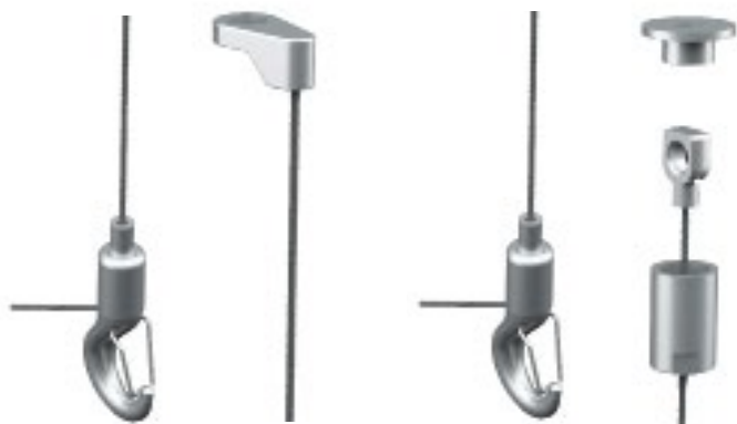
WIREKITS - KLASSISK LØSNING

Vi har utviklet to nye wirekits med en 1500 mm justerbar metallwire som er ideelle til Rockfon flåte- og baffel løsninger.